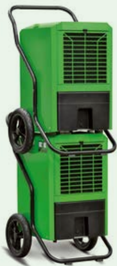
REMKO Luftentfeuchter sind stapelbar