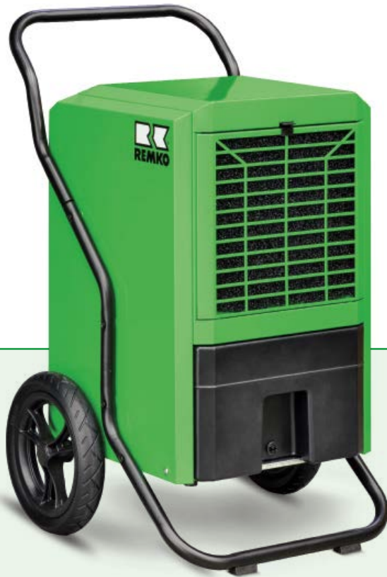
REMKO LTE 60

Trocknen und Entfeuchten zuverlässiger als Sonne und Wind