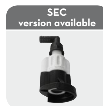
SEC version available