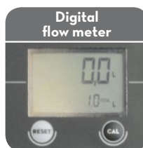
Digital flow meter