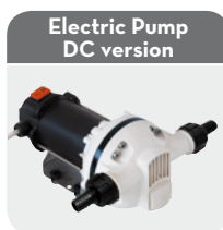
Electric Pump DC version