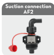
Suction connection AF2