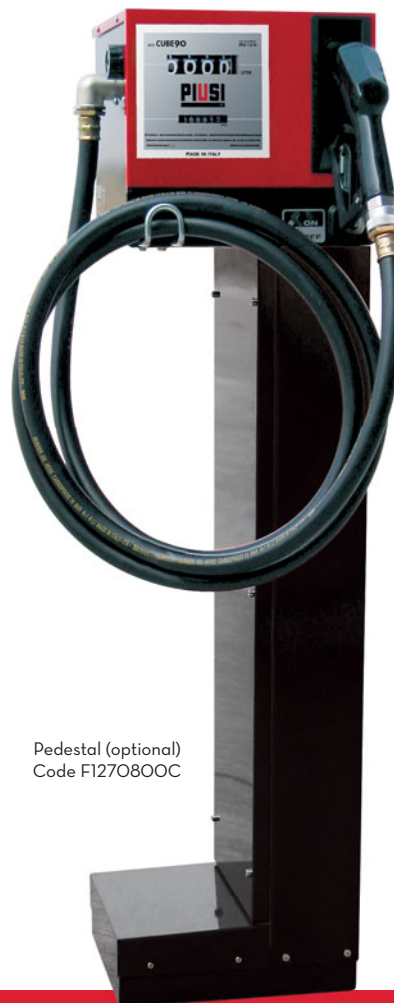
Pedestal (optional) Code F1270800C