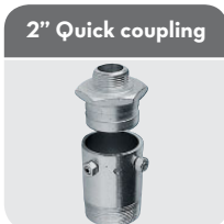
2" Quick coupling