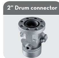
2" Drum connector