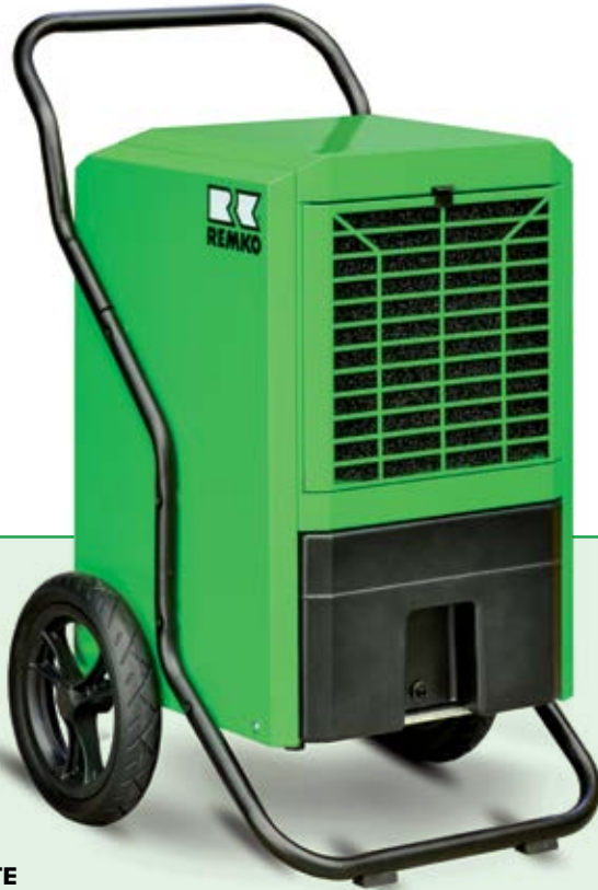
REMKO LTE 60

Trocknen und Entfeuchten zuverlässiger als Sonne und Wind