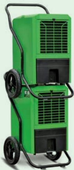
REMKO Luftentfeuchter sind stapelbar